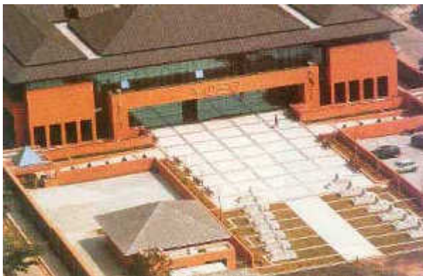
Visão aérea da nova sede do Pró-Vida

“Se você já estiver preparado, uma força maior o levará ao Pró-Vida”